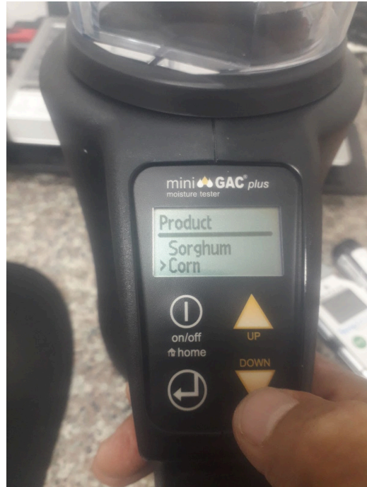
Revisión del Menú de tipo de granos