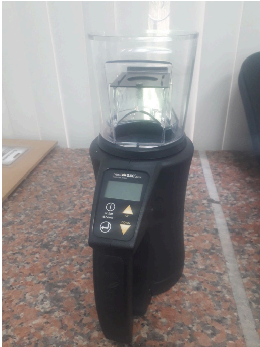
Equipo en Perfectas Condiciones