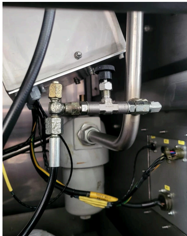
Fotografía 2. Tubería sin filtraciones.