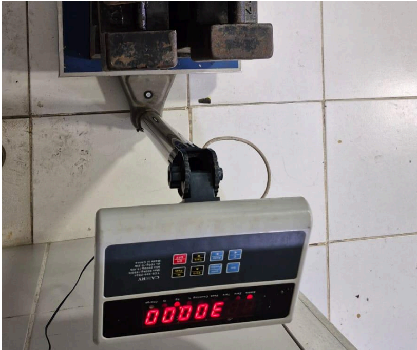
Figura 1. Funcionamiento y ajuste del equipo.