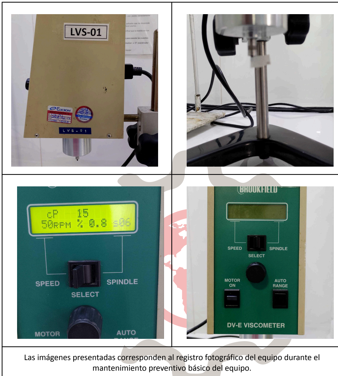
Las imágenes presentadas corresponden al registro fotográfico del equipo durante el mantenimiento preventivo básico del equipo.