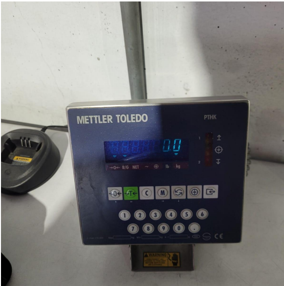
Vista General del equipo.