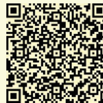
Metal Mecánica Móvil