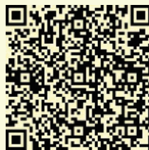
Metal Mecánica Fijo