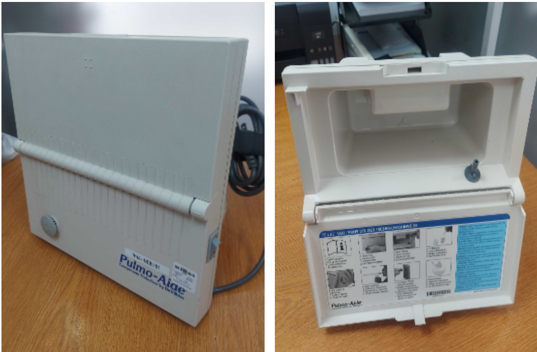
Figura 1. Vista General del Equipo.