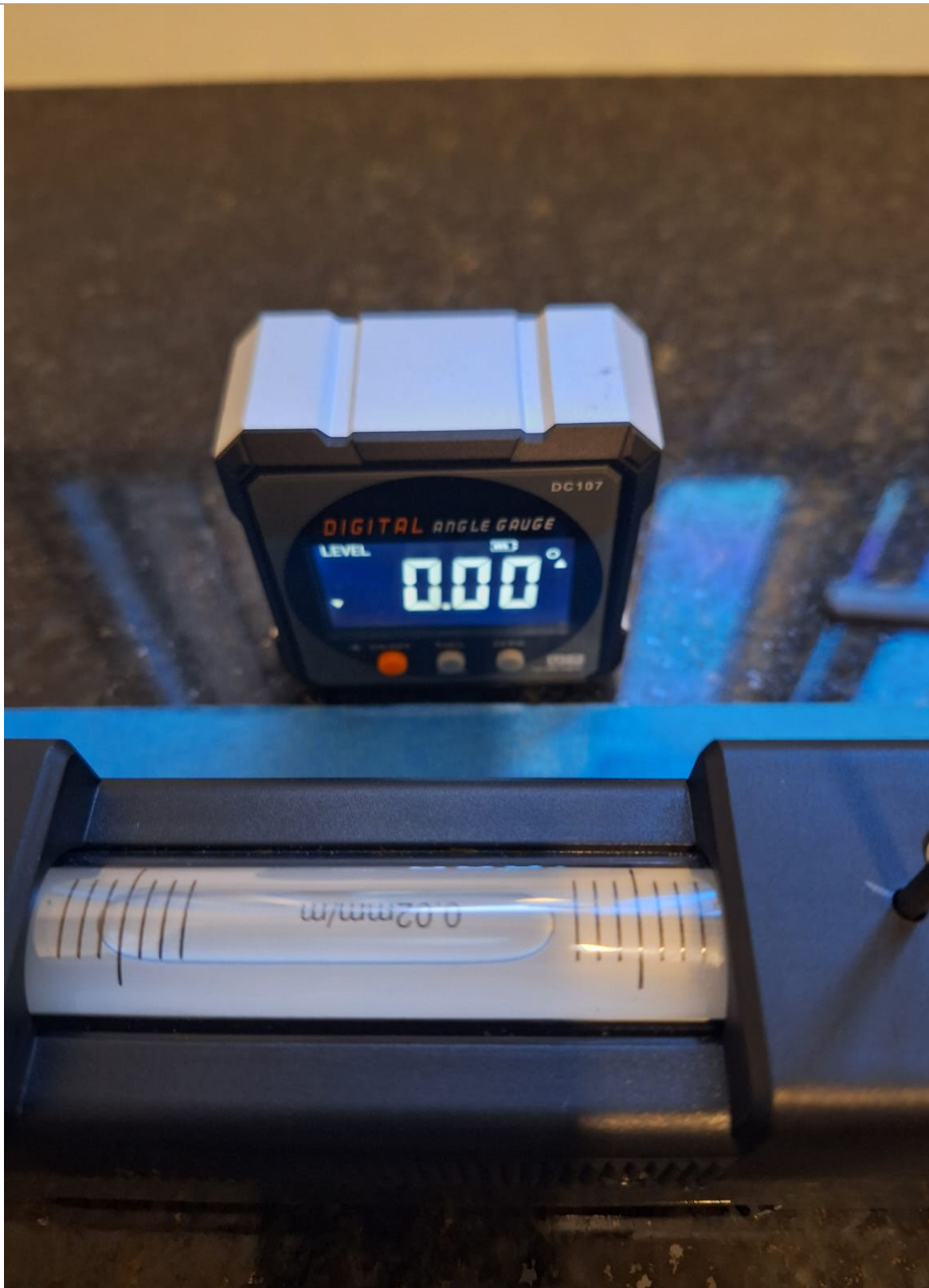
Fig 1 Medición del desplazamiento en 1ra posición