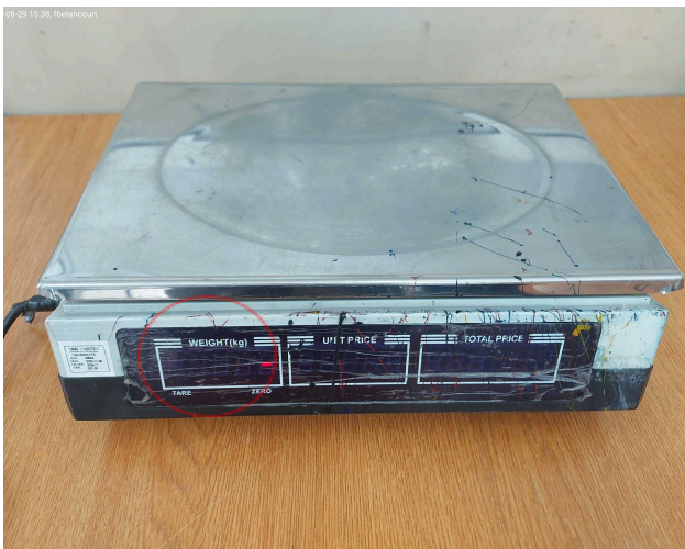
Figura 3: Encendido del equipo.