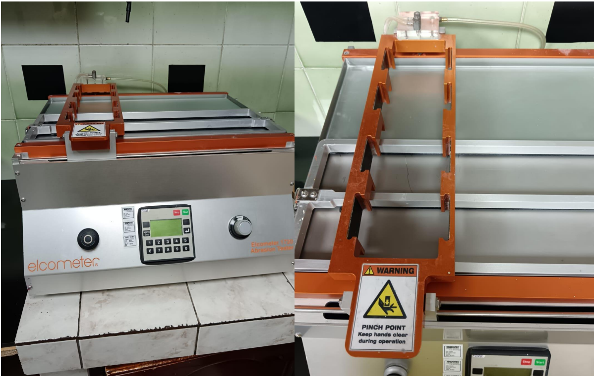
Figura 1. Vista Genera y prueba del Equipo.