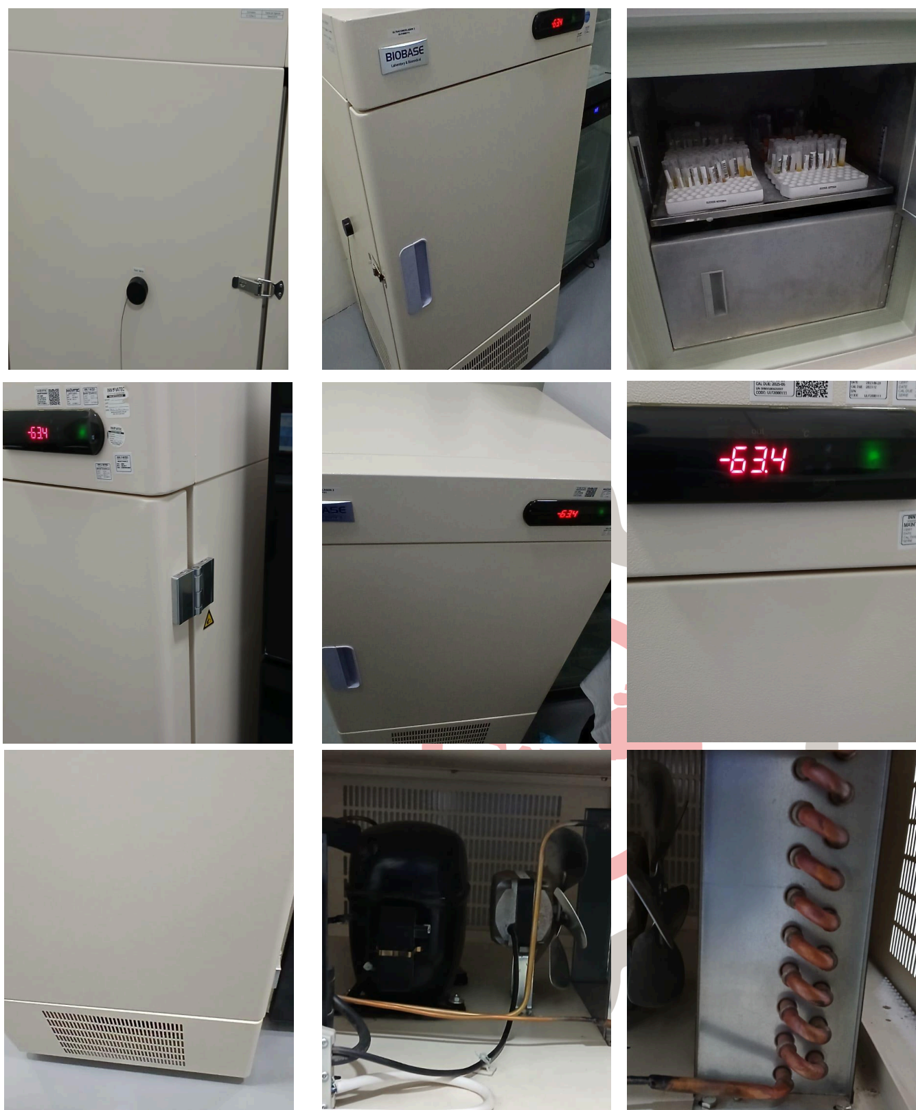
Fig. 1 Mantenimiento del Ultracongelador