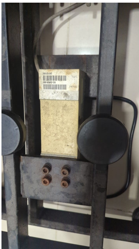
Fig 2 Mecanismo de celda de peso