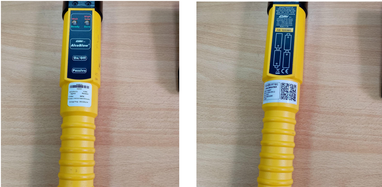
Fig. 1 Vista general del Equipo (Vista frontal y botones)