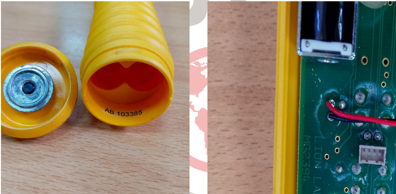
Fig. 2 Conexión batería