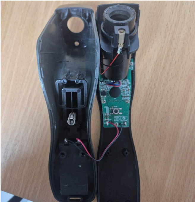
Figura 1. Vista frontal del equipo.