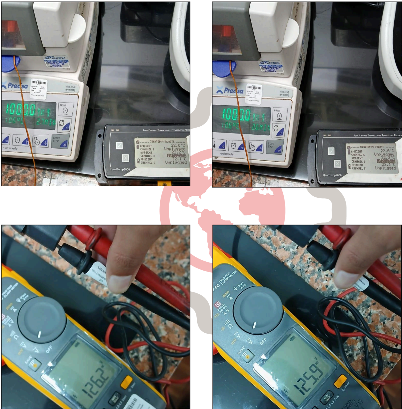
Fig. 2 Verificación termocupla y cable de poder