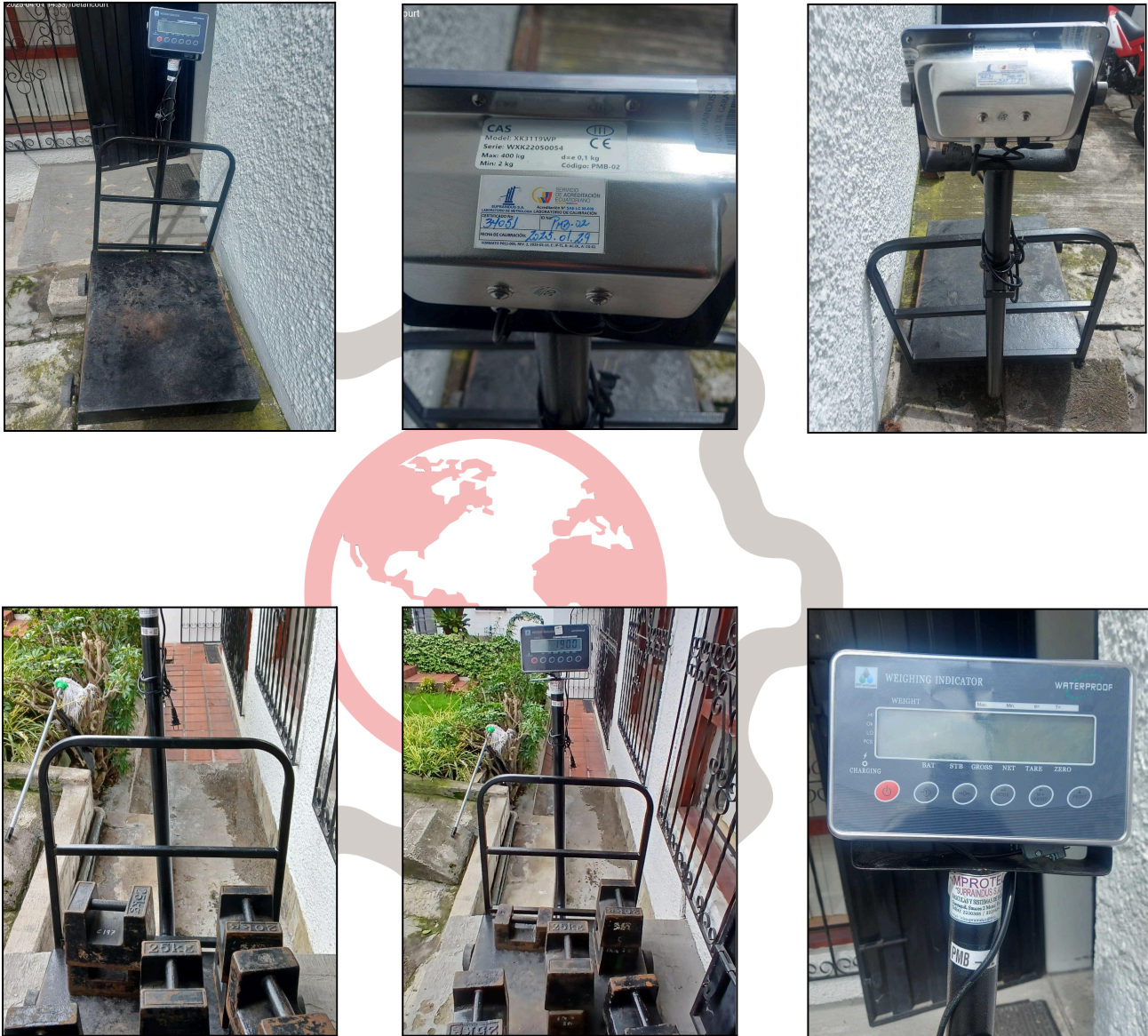
Fig. 1 Revisión Técnica