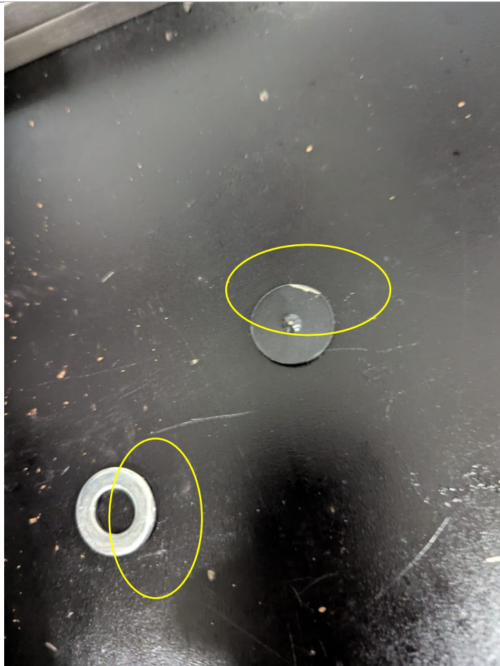
Fig 1 Arandelas de ajuste luego de rabajar las áreas afectadas por el atasque