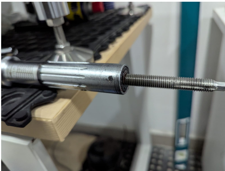
Fig. 3 Armado final, se recuperó el movimiento fluído del tornillo