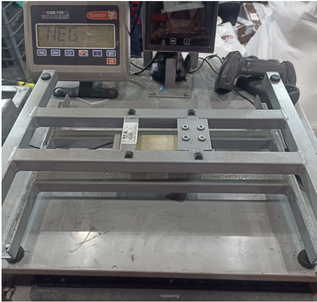
Vista General del equipo.