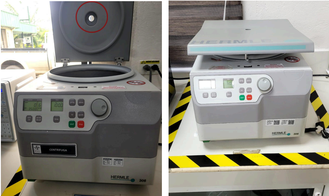
Figura1: Estado superficial del Equipo.