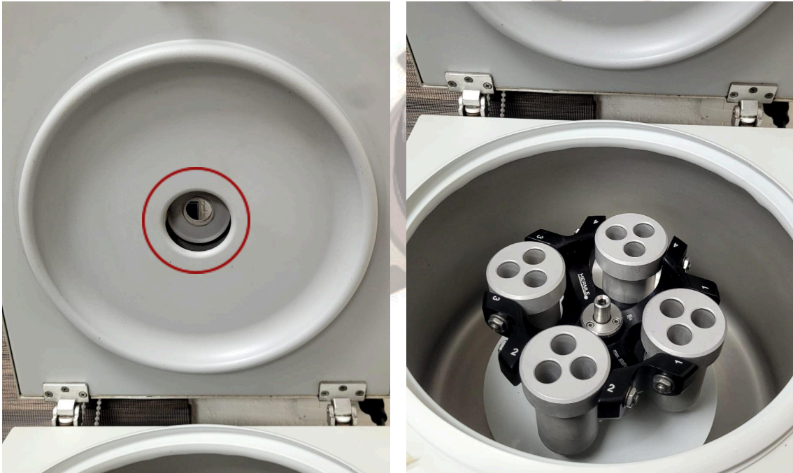
Figura2: Mantenimiento interno del Equipo.