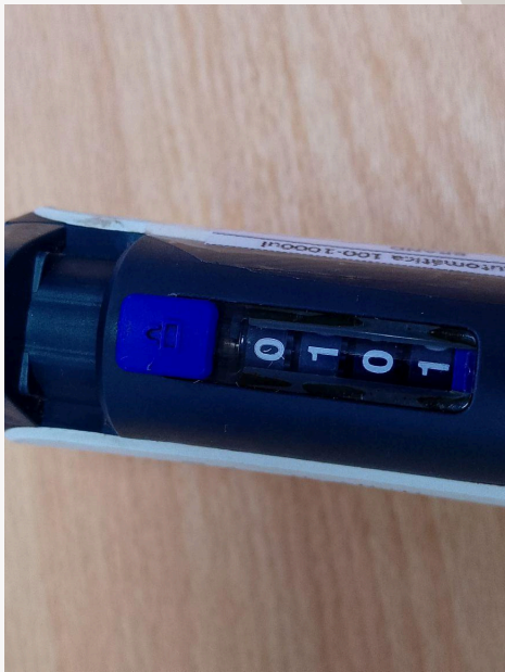
Fig. 3: Dial de medición