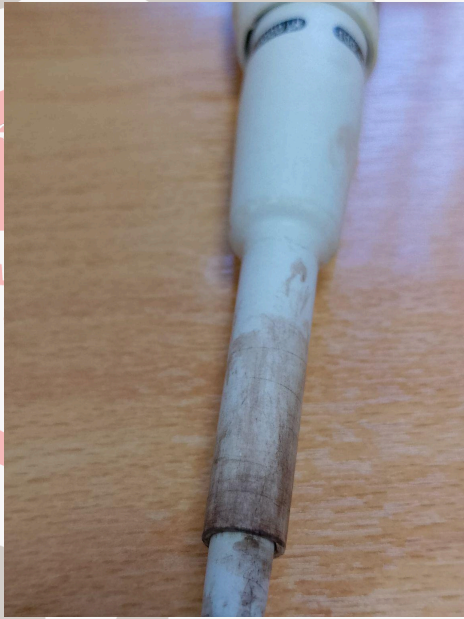
Fig. 4: Eje y eyector de puntas