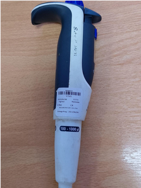
Fig. 1: Vista general del Equipo (Vista lateral izquierda)