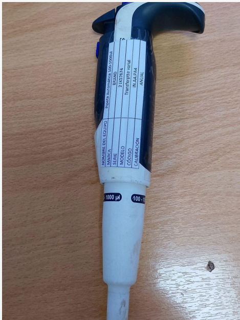
Fig. 2: Vista general del Equipo (Vista lateral derecha)