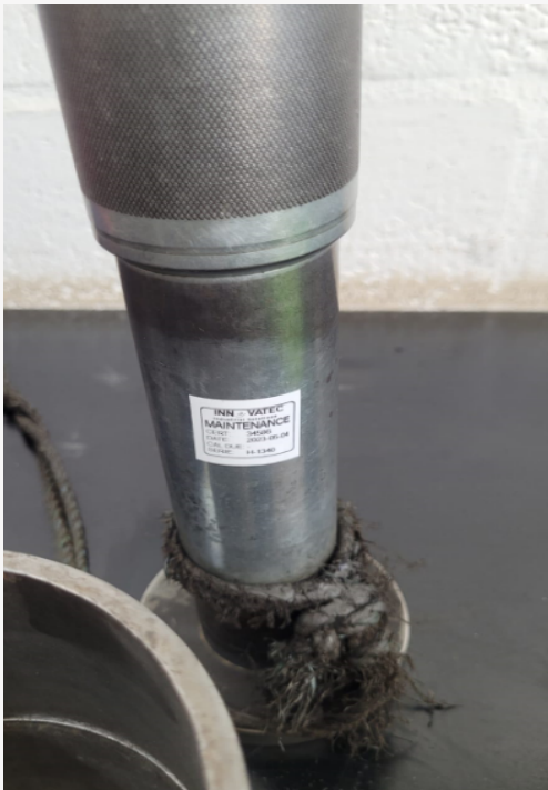
Figura 1: Estado Superficial del Martillo