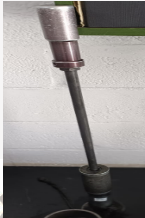
Figura 2: Estado de la estructura Externa