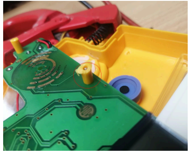
Figura 2: Fisura del remache.