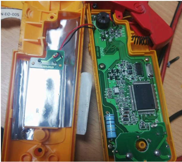
Figura 1: Placa del equipo.