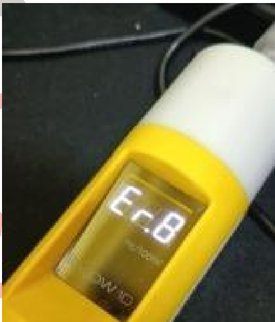
Fig. 4 Prueba patrón