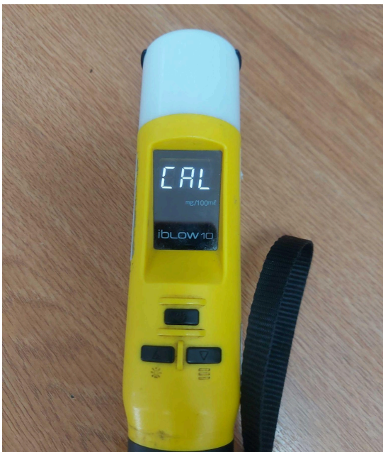
Fig. 3 Desbloqueo