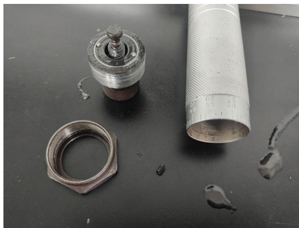
Fig 1 Desmontaje del mar

Se observa que el tornillo de ajuste está trasroscado, se encontro piezas pobremente lubricadas. Se lubricó minuciosamente el tornillo de ajuste, el cual aún seguia sin moverse.