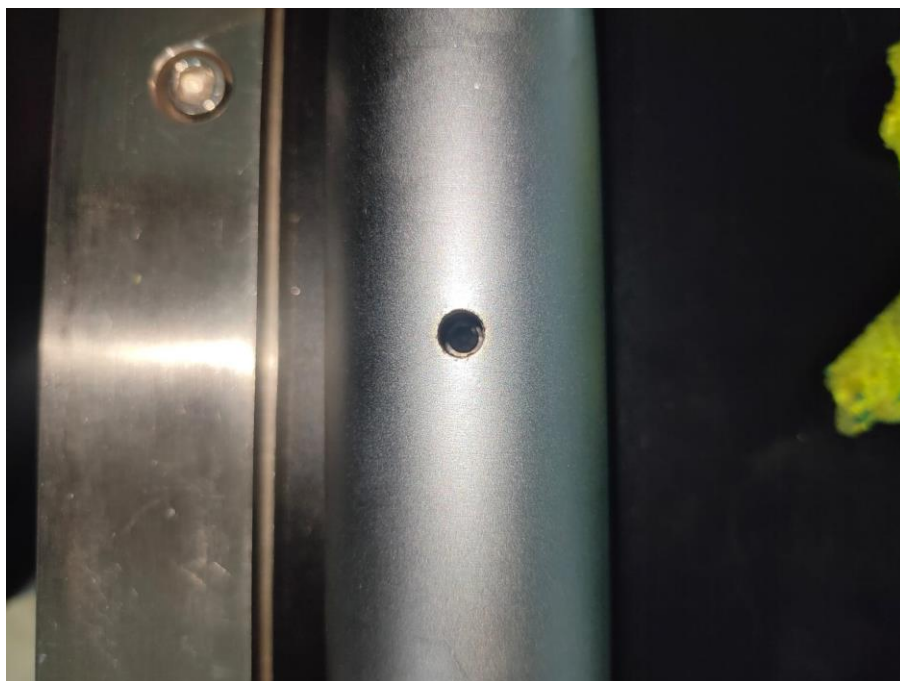
Fig. 3 Tornillo de ajuste atascado