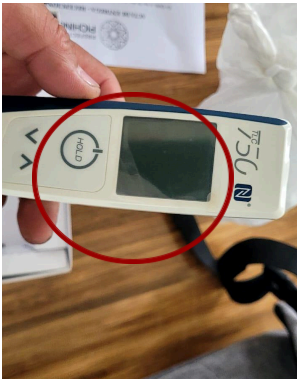
Celda de carga afectada.