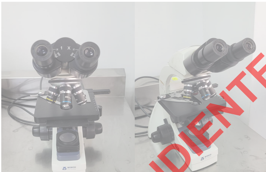
Vista General del Equipo.