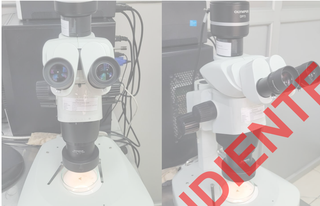
Vista General del Equipo.