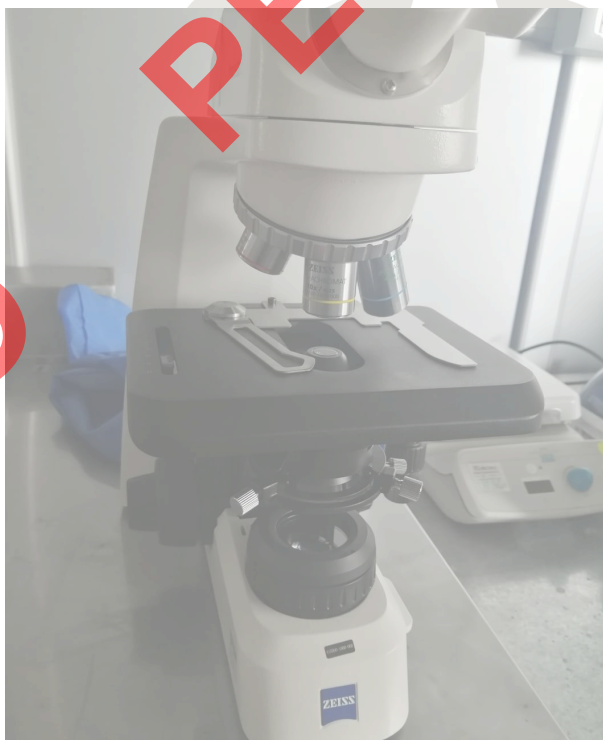
Figura 3. Vista general del equipo.