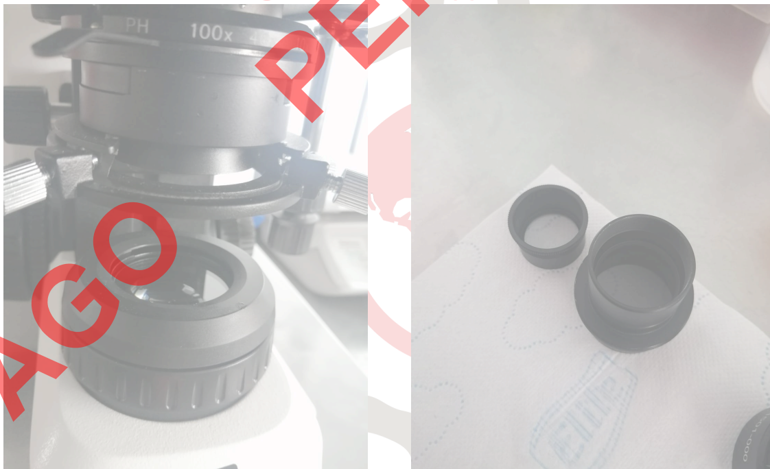
Figura 2. Vista del equipo y sus accesorios.