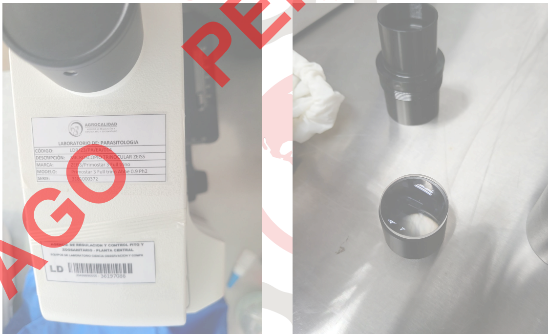
Figura 2. Vista posterior del equipo y sus accesorios.