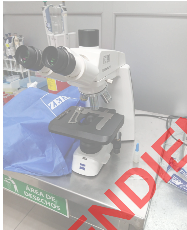
Figura 3. Vista general del equipo.