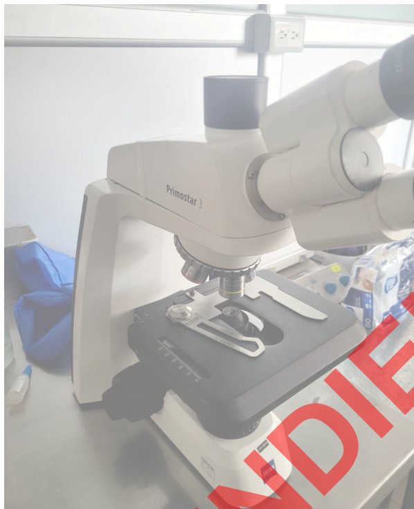
Figura 1. Vista frontal del equipo.