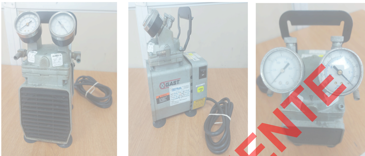
Figura 1. Vista General del Equipo.