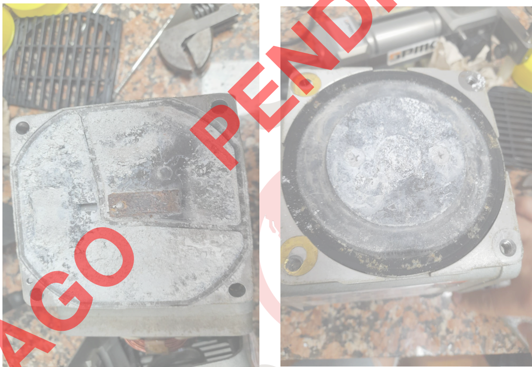
Figura 2. Acumulación de material particulado .