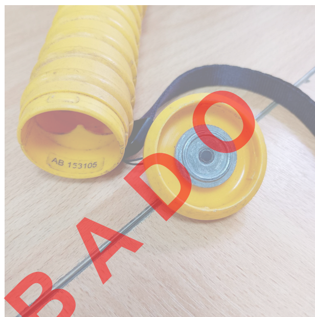
Fig. 1 Vista general del Equipo (Vista frontal y posterior)