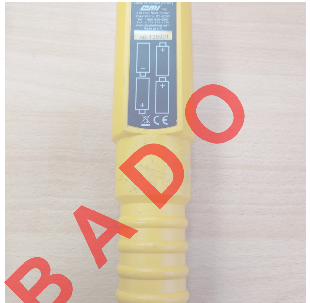
Fig. 1 Vista general del Equipo (Vista frontal y posterior)