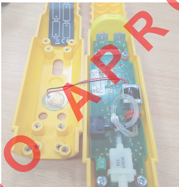
Fig. 2 Compartimento Muestras