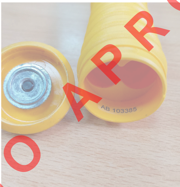
Fig. 2 Conexión batería