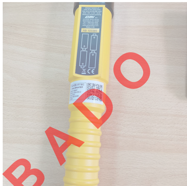
Fig. 1 Vista general del Equipo (Vista frontal y botones)