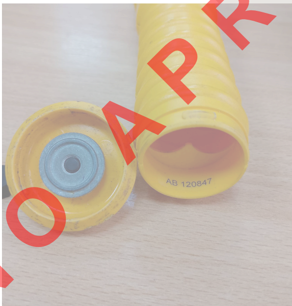
Fig. 2 Conexión batería