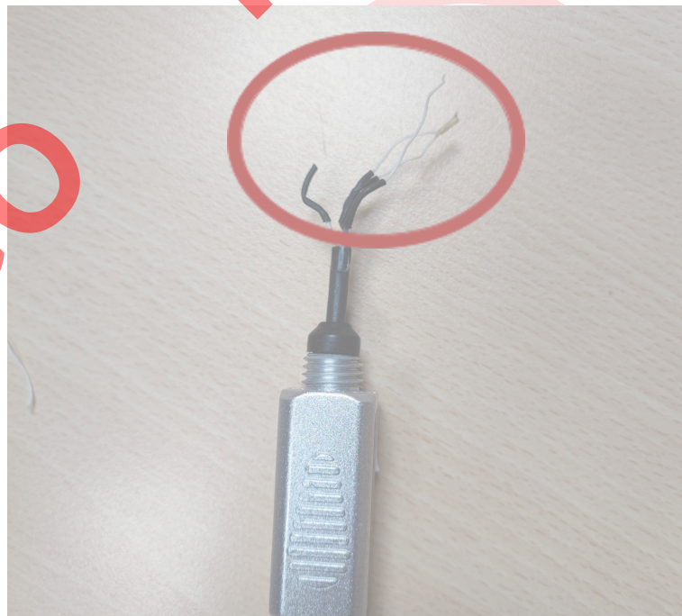
Cables rotos y separados