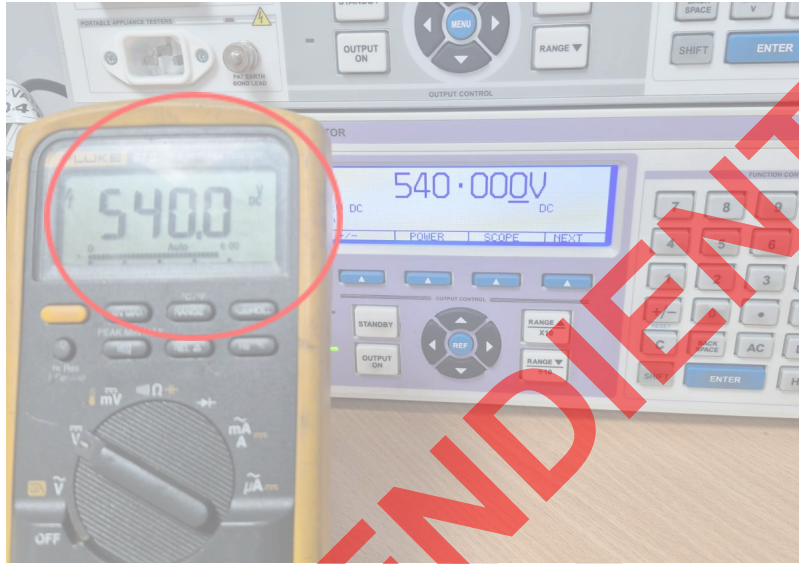
Figura 4. Verificación de valores del multímetro.