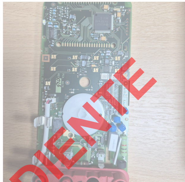
Figura 2. Vista de la sustitución de la placa electrónica.