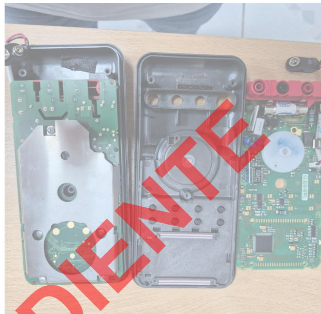
Figura 2. Vista de las placas electrónicas de los multímetros.