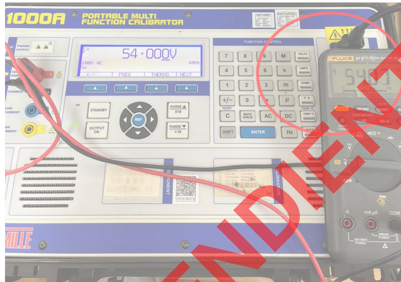
Figura 4. Verificación de valores del multímetro.