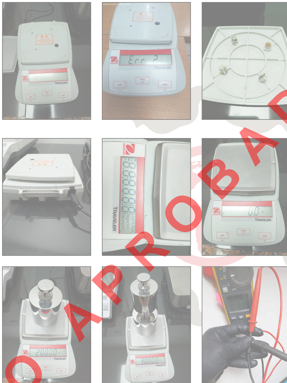
Fig. 1 Revisión Técnica