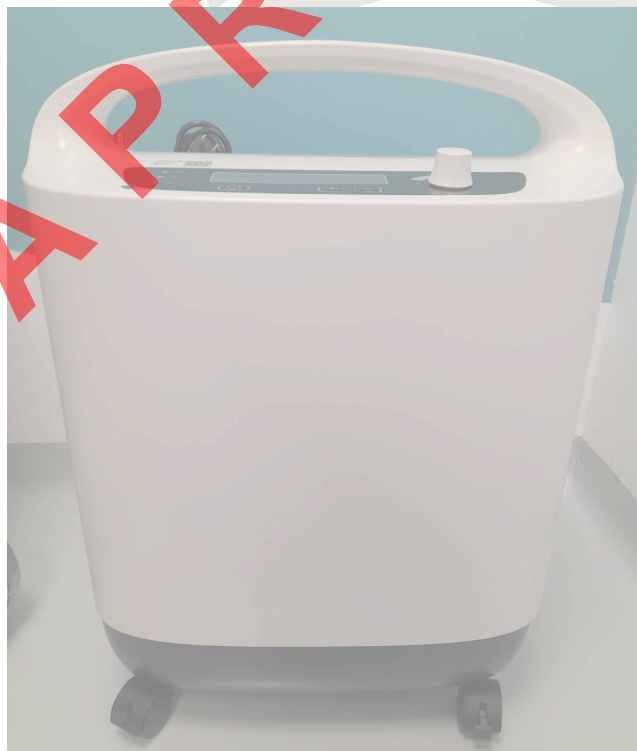
Figura 1. Vista General del equipo y mantenimiento.