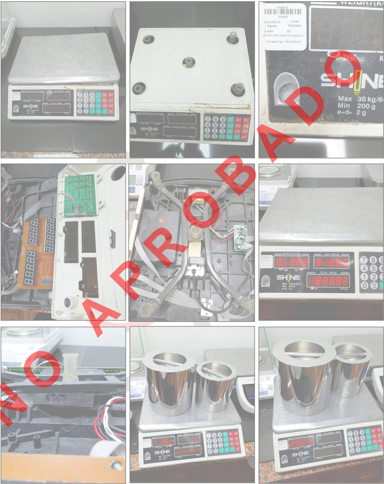
Fig 1. Mantenimiento Preventivo Básico