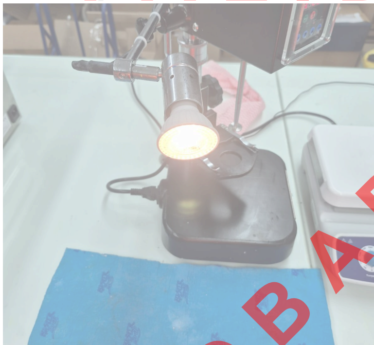
Figura 3. Encendido de la lámpara.