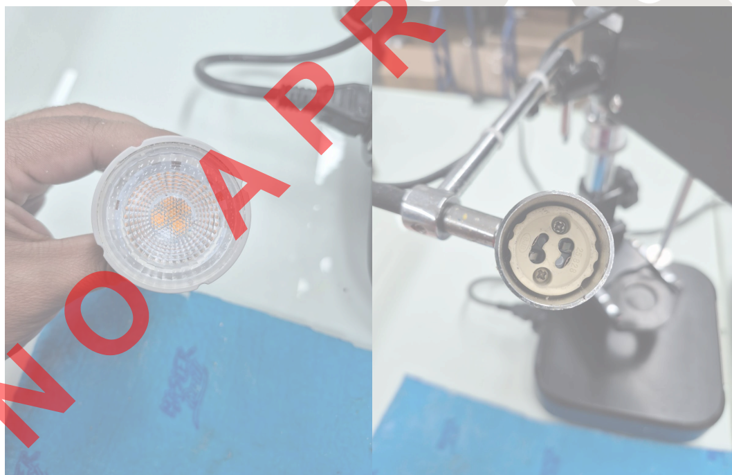
Figura 4. Componentes de la sección lámpara.