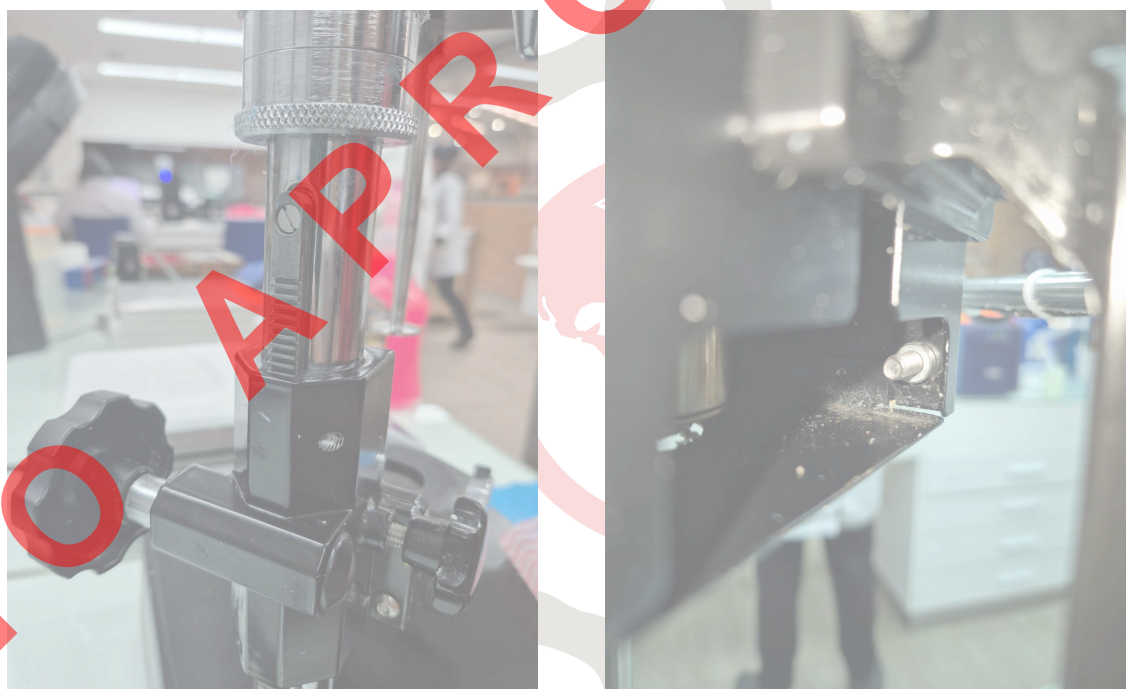
Figura 2. Elementos del equipo.