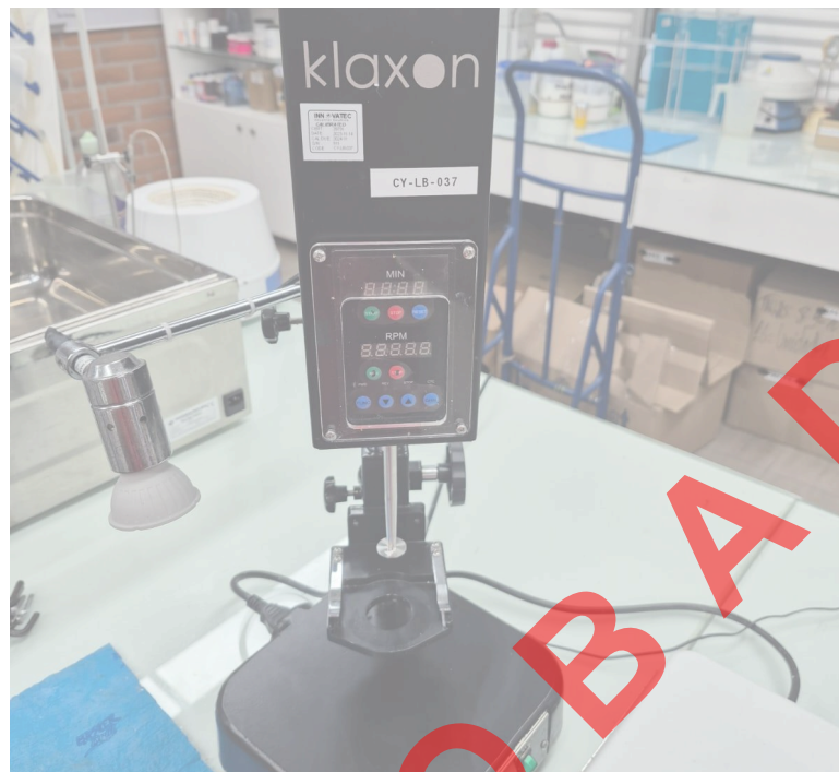
Figura 1. Vista frontal del equipo.