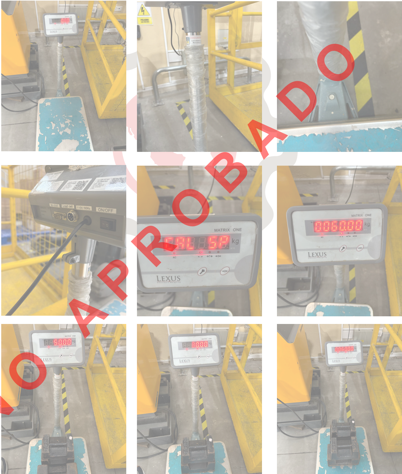
Fig. 1 Mantenimiento preventivo básico