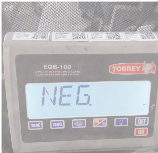
Figura 1. Mantenimiento preventivo básico