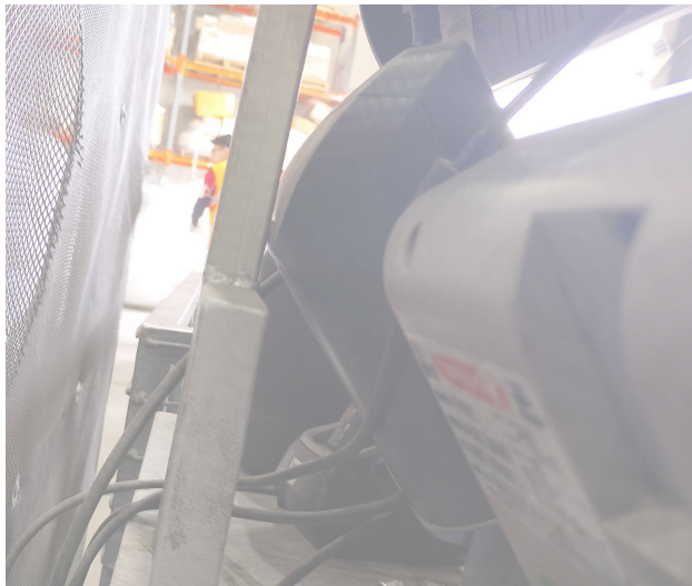
Figura 1. Mantenimiento preventivo básico