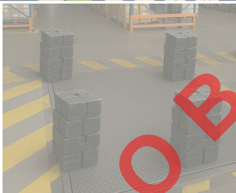
Vista General del equipo.