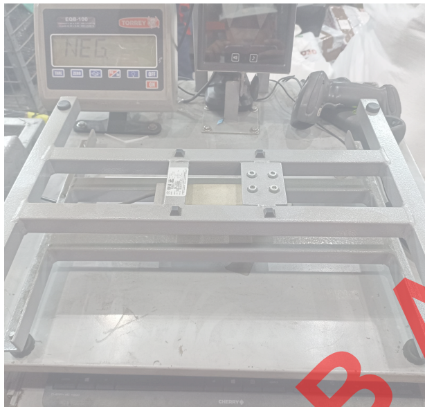
Vista General del equipo.