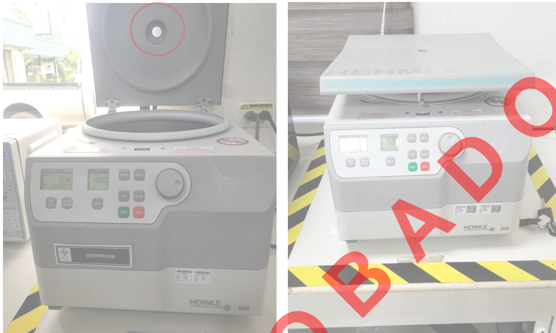
Figura1: Estado superficial del Equipo.