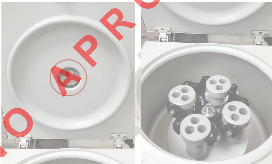
Figura2: Mantenimiento interno del Equipo.