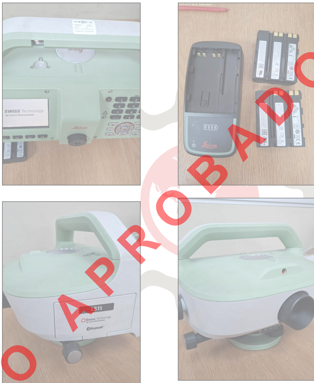
Fig. 1 Revisión Técnica