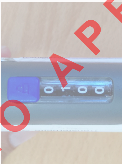
Fig. 3: Dial de medición