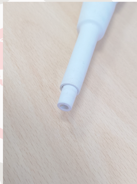
Fig. 4: Eje y eyector de puntas