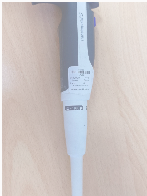
Fig. 1: Vista general del Equipo (Vista lateral izquierda)