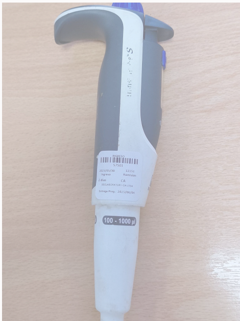
Fig. 1: Vista general del Equipo (Vista lateral izquierda)