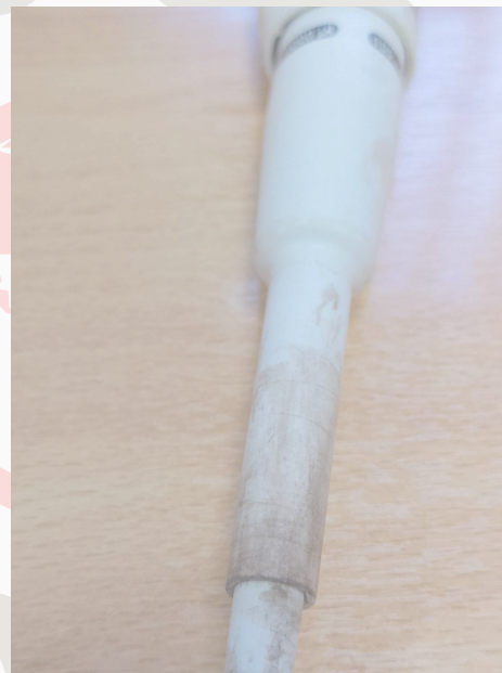
Fig. 4: Eje y eyector de puntas