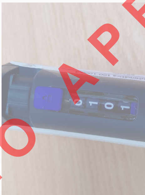
Fig. 3: Dial de medición